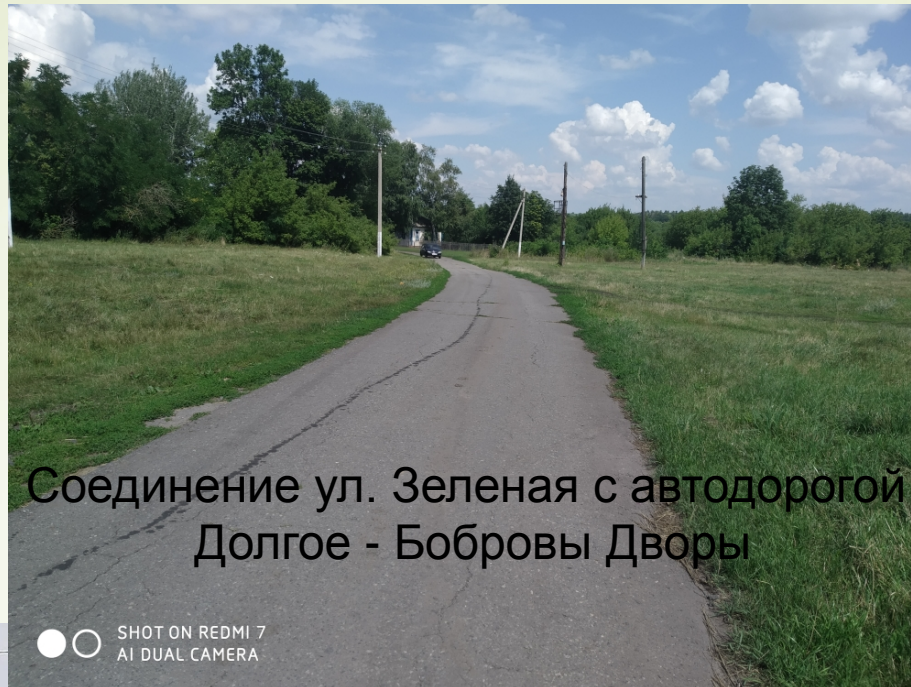
Соединение ул. Зеленая с автодорогой Долгое - Бобровы Дворы