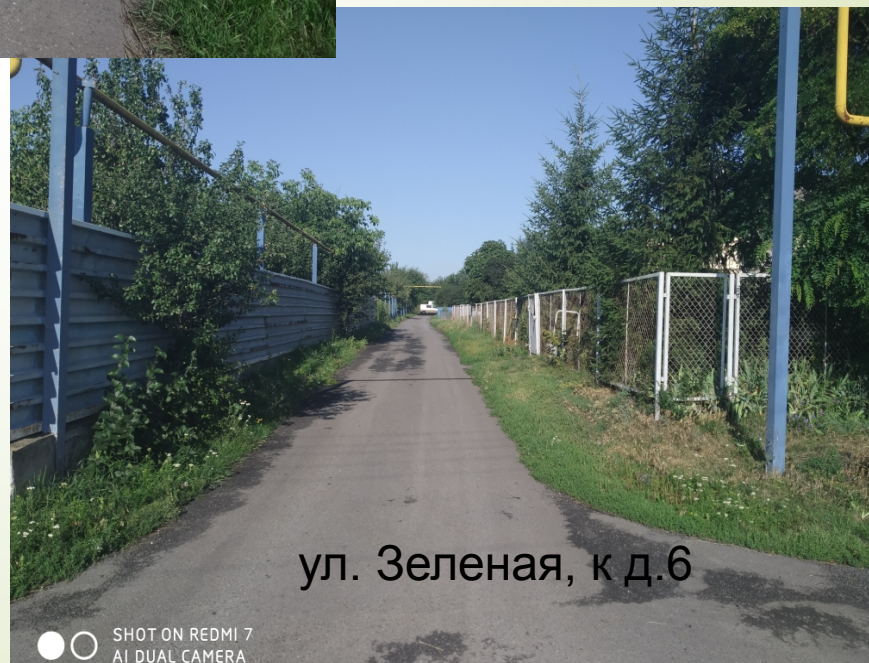
ул. Зеленая, к д.6