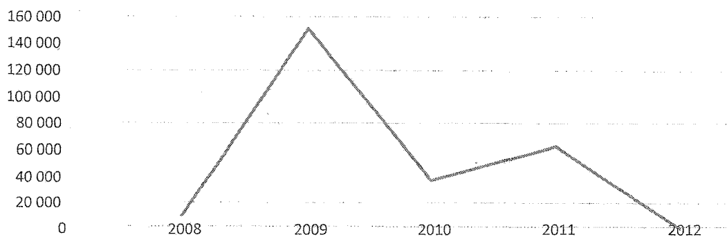
Рисунок 2. Объем денежных средств, направленных на переселение граждан