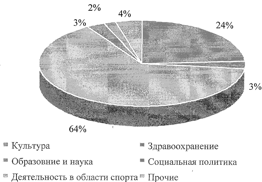
Рисунок 4. Структура бюджетной сферы Губкинского городского округа