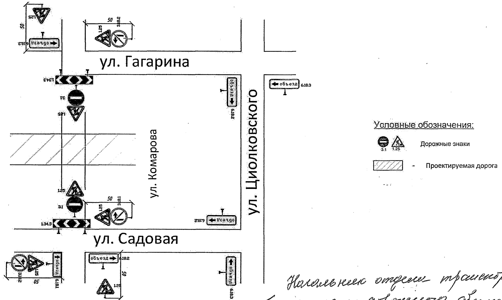
Схема организации дорожного движения на период проведения работ по строительству подъездной автодороги в г. Губкине от мкр. «Журавлики» до автодороги «Короча-Губкин-граница Курской области»

Начальник отдела транспорта и безопасности дорожного движения Нерсис А.А. Нерсисов