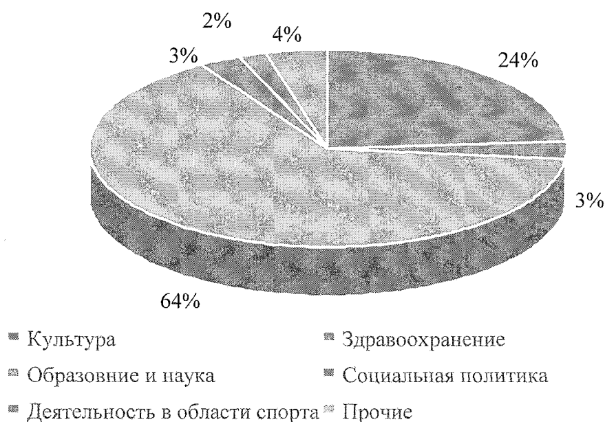
Рисунок 4. Структура бюджетной сферы Губкинского городского округа

Энергосбережение в учреждениях бюджетной сферы - одна из самых острых в России проблем и Губкинский городской округ не является исключением. Эта проблема стала особенно актуальной за последние 4 года в связи с резким повышением стоимости электрической энергии, топлива, тепловой энергии и воды.