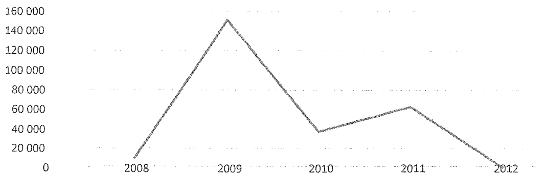
Рисунок 2. Объем денежных средств, направленных на переселение граждан