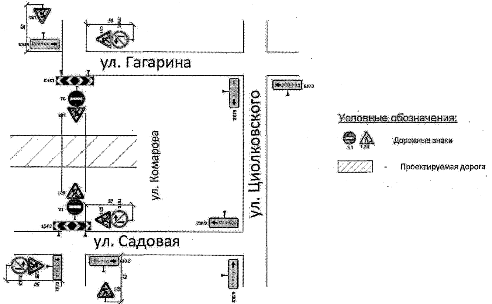
Схема организации дорожного движения