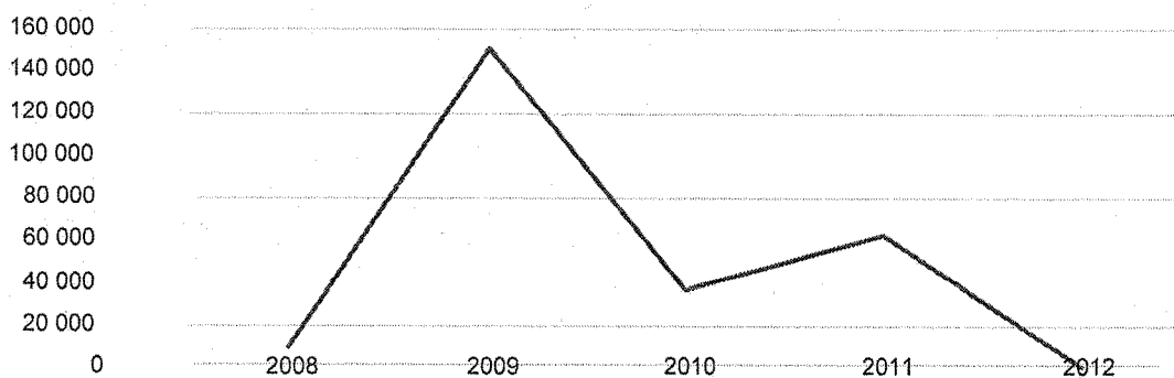
Рисунок 2. Объем денежных средств, направленных на переселение граждан